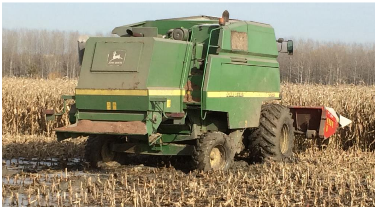
1. kép: Sár - tengeri

A betakarítás intenzitására jellemző, hogy szeptemberben csupán 2, és október első felében is csak 4 parcellához hívtak ellenőröket. (1. ábra) Október 16.-a után már támadt némi mozgolódás, de igazi kampányról csak a hónap utolsó hetében beszélhetünk. Október 26. és 31. között 21 parcella ellenőrzése történt meg, miközben a csúcsonapon (október 31.) az ellenőrök 8 versenyterületen felügyelték az eseményeket. Az ünnepnapok (november 1. és 2.) teljes betakarítási csendben teltek, majd ismét lendületet vett a folyamat, s november 3.-tól 14.-ig újabb 23 parcella termését legelték le a kombájnok. Végül az utolsó parcellákat is sikerült a november 30.-ig kinyújtott határidő előtt naplózni.