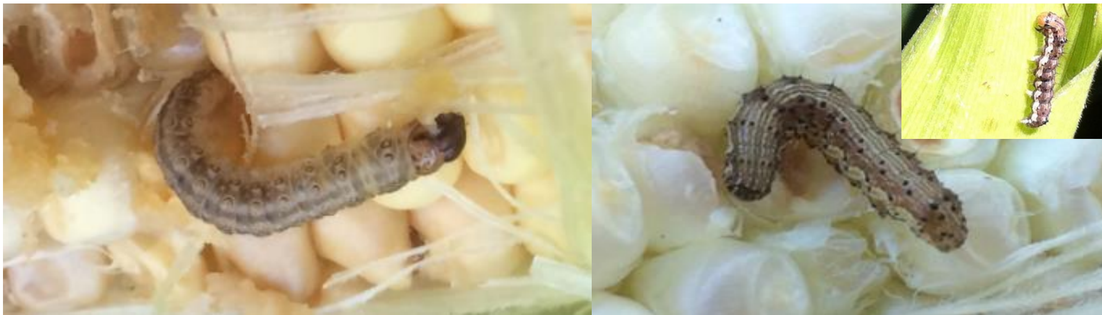
Gyapottok bagolylepke hernyó