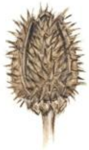
Csattanó maszlag ( Datura stramonium )