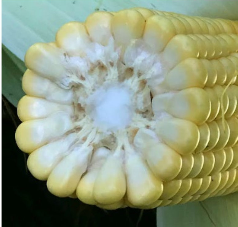
5. ábra: tejesérés végén, viaszérés kezdetén lévő kukoricacső keresztmetszete. Jól látható, hogy a szemekben a folyadék a kupa felől sűrűsödik, s halad a csutka felé. Jól látható a köldök - a tápcsatorna, amellyel a kukoricaszem kapcsolódik és rögzül a csutkához - a kétsoros elrendezés is jól kivehető, ami miatt a kukoricacsövön a sorok mindig párosak.