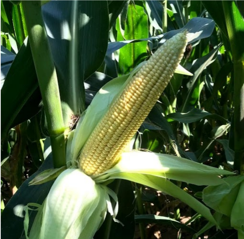
3. ábra: Termékenyülés utáni érettségi állapot (DKC5542). A csúcsi szemek a szemkötődést követő (szemképződési állapot kezdete (R2), angolul blister, magyar megfelelőjét nem találtam, a szakirodalom nem nevezi meg, lefordítva talán a magyarban nem túl jól hangzó „vízhólyag” felelne meg leginkább) érettségi fokozatban vannak – kedvezőtlen időjárási hatásokra nem telítődnek ki, a cső „elvetéli” őket. Nyomásra ezekből a szemekből még vízszertű folyadék fröccsen ki. Lejjebb az érettségi állapot fokozatosan megy át a tejes érésbe (R3, a szemek sötétebb színe jelzi). A nyomásra kifröccsenő folyadék tejfehér.