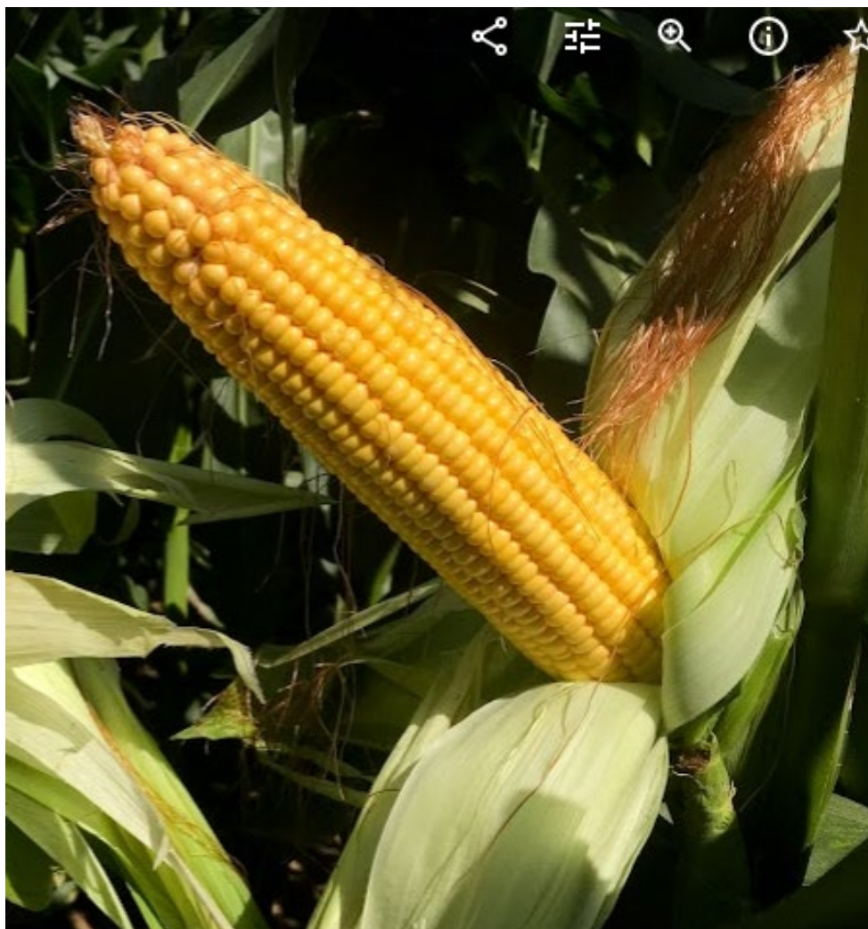
4. ábra: Tejesérésben lévő kukoricacső (P9978). a szemek színe jelzi a bennük lévő folyadék sűrűsödését, viaszosodását. A kupanyom képződés még nem indult meg.