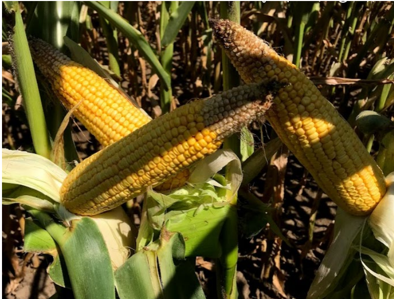
6. ábra: Kupanyom kialakulásának kezdete, amely a viaszérés előrehaladását, azaz a felhalmozódó tápanyagok víztartalmának csökkenését jelzi. Látható, hogy még jelentős a „tejes” szemek aránya. A csöveken látható, hogy a súlyos aszály hatására a szemek mintegy 30%-a visszafejlődött. (Szabadbattyán határában, április 21-én vetett kukoricában.)