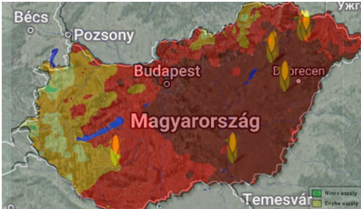
2. ábra: Magyarország aszálytérképe (met.hu) a XIV. Kukorica Termésversenyre július 31-ig regisztrált vrsenyzőkkel