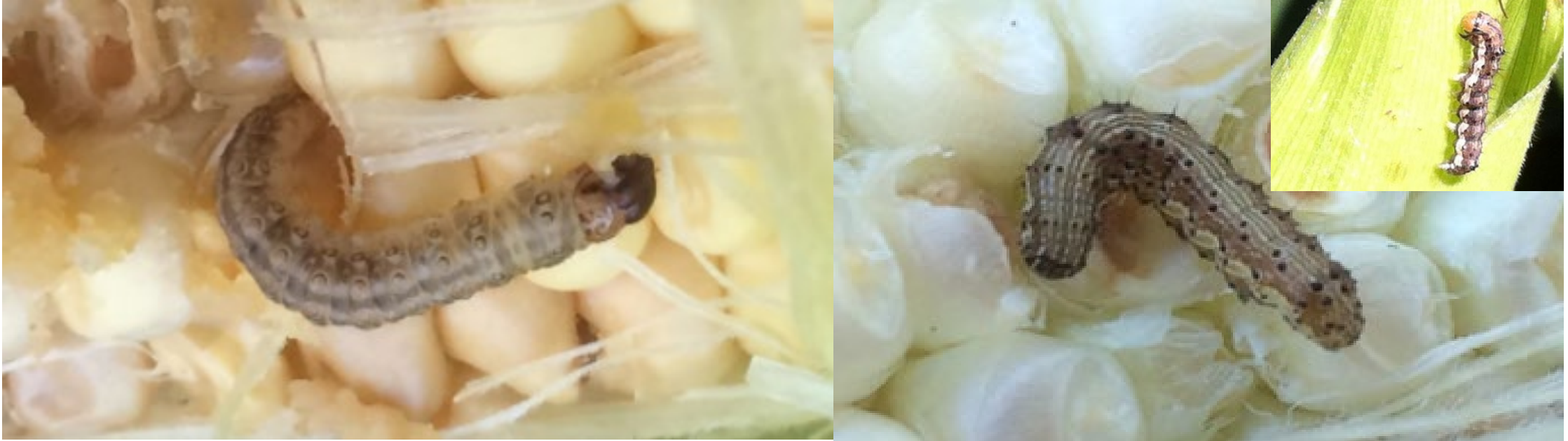
Gyapottok bagolylepke hernyó