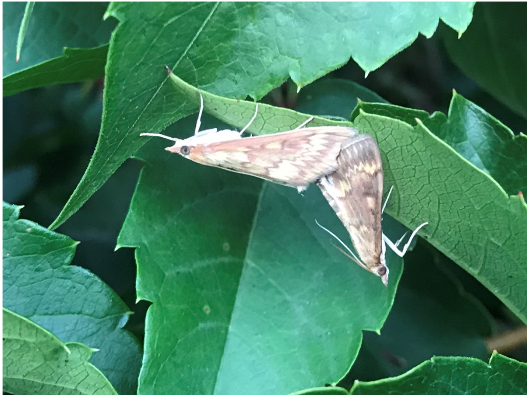
Párizó kukoricamoly lepkék (nőstény balra)