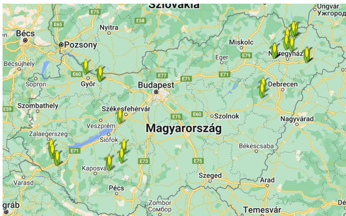
1. ábra: A XVI. Kukorica Termésverseny bejelentett parcelláinak eloszlása (A térkép ITT érhető el)

A XVI. Kukorica Termésversenyt támogatták a Bayer Hungária Kft., az Agro Masters Hungary Kft. (Moravszki Farm Kft) és a Dr. Szabó Agrokémiai Kft. (Agrofőnix Kft.)